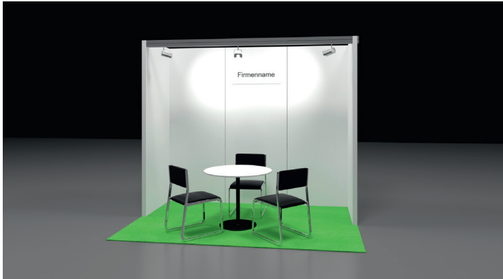
Beispiel Stand G1, weiss