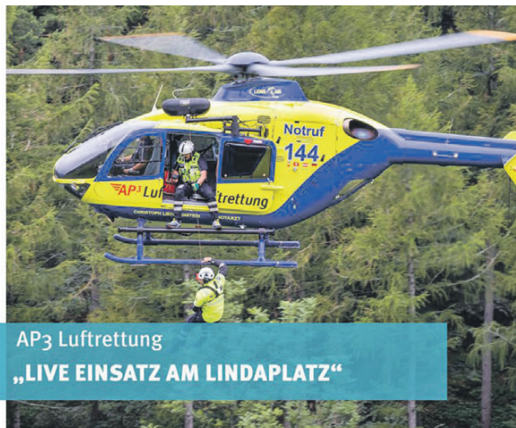
AP3 Luftrettung „LIVE EINSATZ AM LINDAPLATZ“

Ob im Spitzen- oder Breitensport: Die mentale Stärke wird immer entscheidender für den Erfolg. Mentale Stärke entsteht nicht durch Zufall, sondern bedingt ein konsequentes Training.